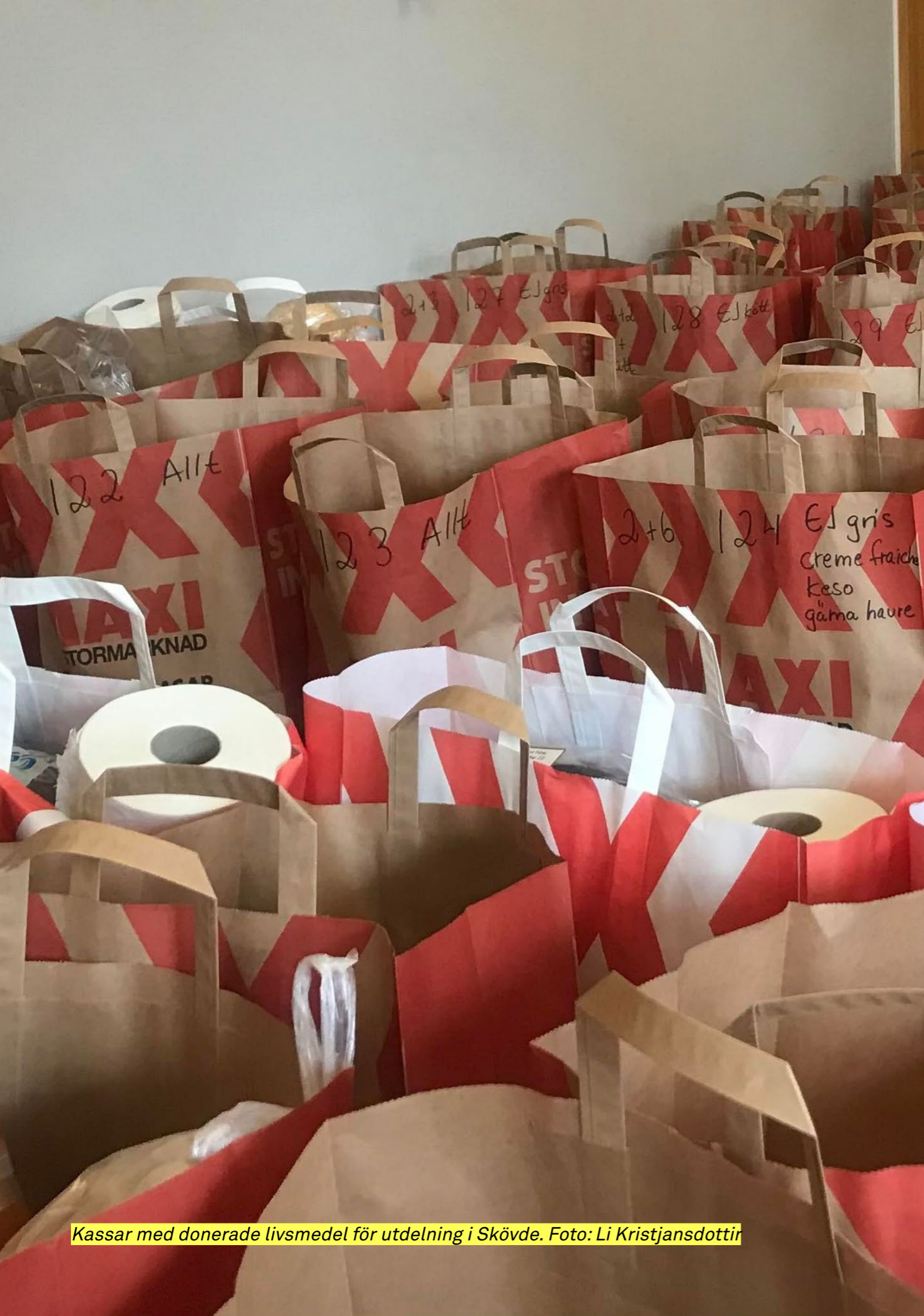
Kassar med donerade livsmedel för utdelning i Skövde.